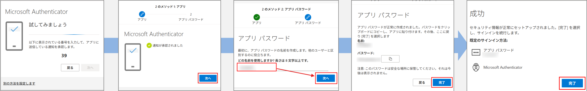
Microsoft Authenticatorに 表示された番号を入力